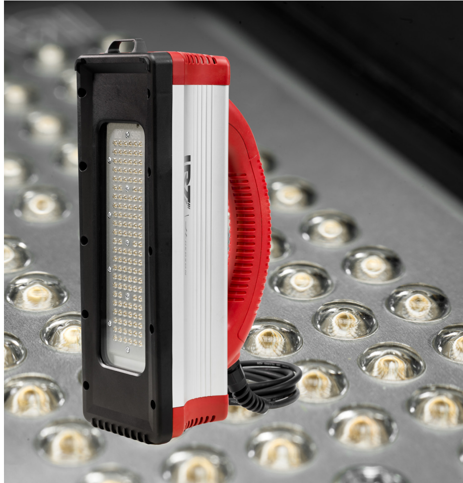
132 högeffekts LED, med unik och individuell optik.

I kombination med kraftfull och temperaturstyrd kylning och avancerat överhettningsskydd, erbjuder SpotCure 2 marknadsledande härdningsresultat på UV-aktiverat material, från IRT - the curing company. Produktlivslängd, driftssäkerhet och ergonomi är alltid högsta prioritet.